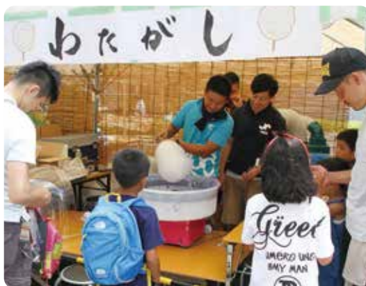
▲安城七夕まつりへの参画