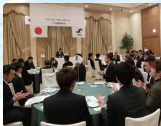
▲卒業生を祝う卒業式例会