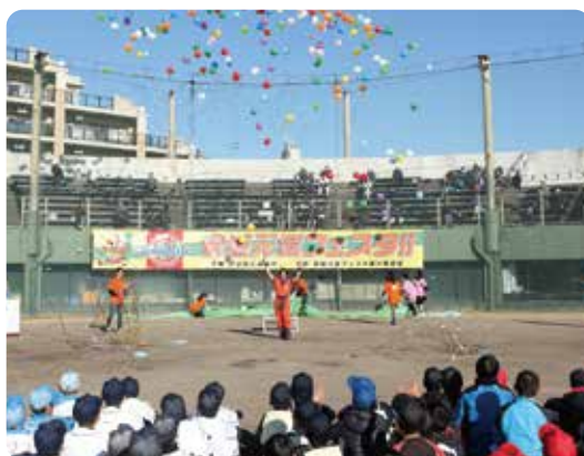
▲安城元気フェスタの運営