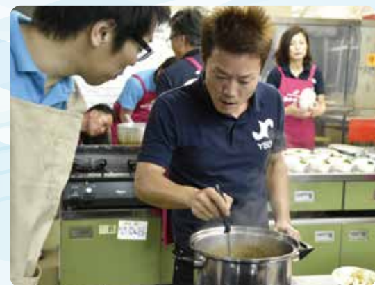
▲カレー作りを通じた交流会