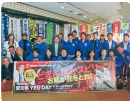
▲愛知県 YEG DAY