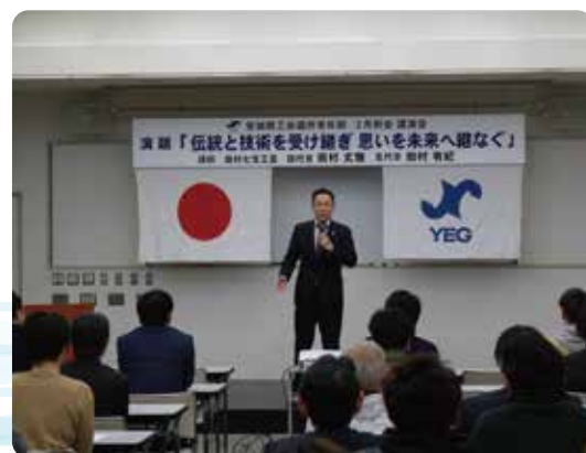
▲講師を呼んでの講演例会