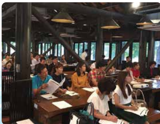
▲家族参加型の講演例会