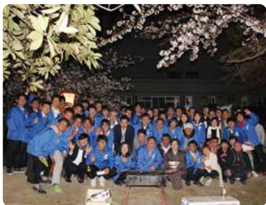
▲4月に行われる花見例会